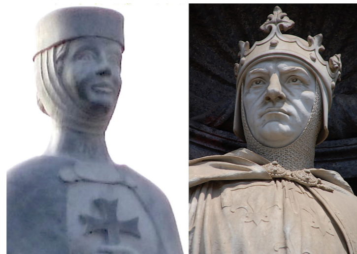
Béatrice de Savoie et son gendre Charles I er d'Anjou